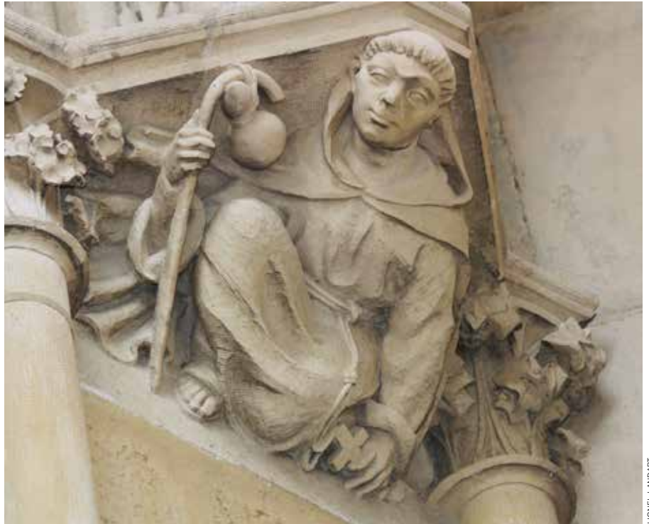
Le pèlerin de la cathédrale de Bayonne, porche nord.

Avant de rejoindre Saint-Jean-de-Luz, les pèlerins passaient par les chapelles de Bidart, en passant par la rue toujours dénommée « rue Saint-Jacques ». Près de l'embouchure de la Nivelle, dans la partie de la ville engloutie depuis lors par les flots, se tenait l'hostellerie des pèlerins, qu'un document de 1357 dénomme « l'hôpital de Saint-Jacques cerca Fontarabia como en Sent Johan de Luy ». Abandonné, puis devenu couvent des Ursulines, cet établissement fut supplanté, en 1623, par un nouvel hôpital Saint-Jacques, situé derrière l'actuelle pergola, disposé à secourir les pèlerins. Dans une chapelle latérale de l'église, un vitrail rappelle le pèlerinage en représentant saint Jacques, dans une posture de matamoros dont