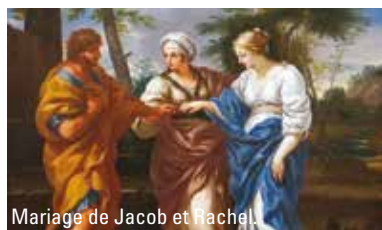
Mariage de Jacob et Rachel

Vivre la famille dans la Bible ouvre un éventail de possibles en termes d'engendrement qui risque de surprendre.