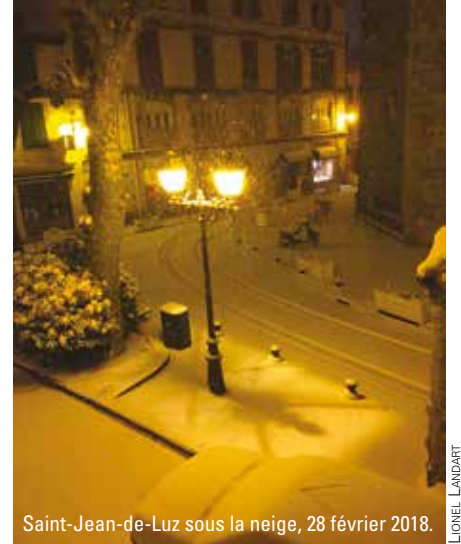
Saint-Jean-de-Luz sous la neige, 28 février 2018.

La sixième extinction de masse, extinction de l'holocène, extinction massive et étendue des espèces durant notre époque contemporaine dite « moderne », est en marche et elle est en grande partie provoquée par notre mode vie et