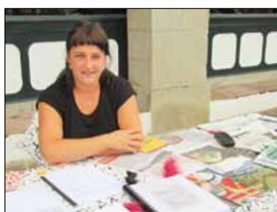
Au marché d'Ascain.

Z iburutarra, hamar bat urte Azkainen bizi dela bere familiarrekin, bi haur, Joanak kondatzen dauku lan beharrak ezkartzen dituen moldaketak. Zonbeit urtez, 2001 tetik geroz, ahaleginak bete ditu lan iraunkor bat ardieste-ko (erakaskuntzan, animazionean, etab...). Noiz egin duzu urrats garrantzitsua ?