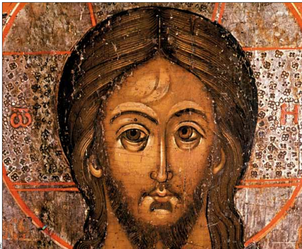
Icone russe du Christ en gloire

Pour la foi chrétienne, la résurrection de Jésus est définitive. Son cadavre n'a pas été simplement réanimé: Jésus a été arraché à la condition mortelle pour entrer dans une autre sorte d'existence, un état de vie radicalement autre, qui reste toutefois mystérieux. À la différence des autres « ressuscités » de l'Écriture, il n'est pas redevenu ce qu'il était avant sa mort. Ceci explique que ses disciples ne le reconnaissent pas d'emblée lorsqu'il leur apparaît.