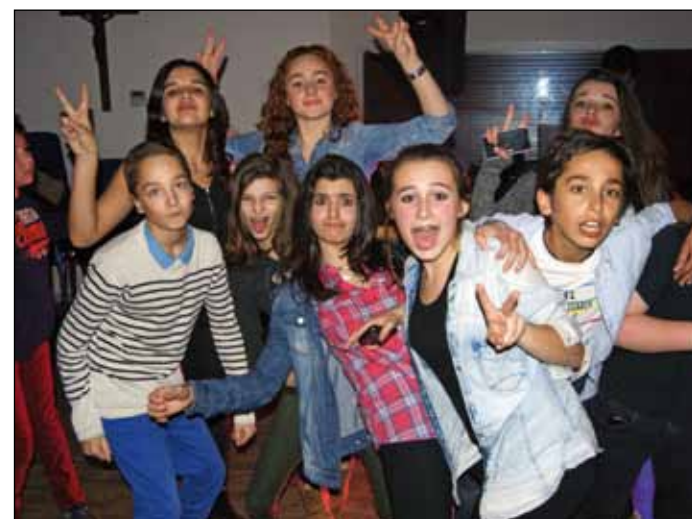
Soirée DJ pour les 4 e et 3 e , le 23 janvier dernier.