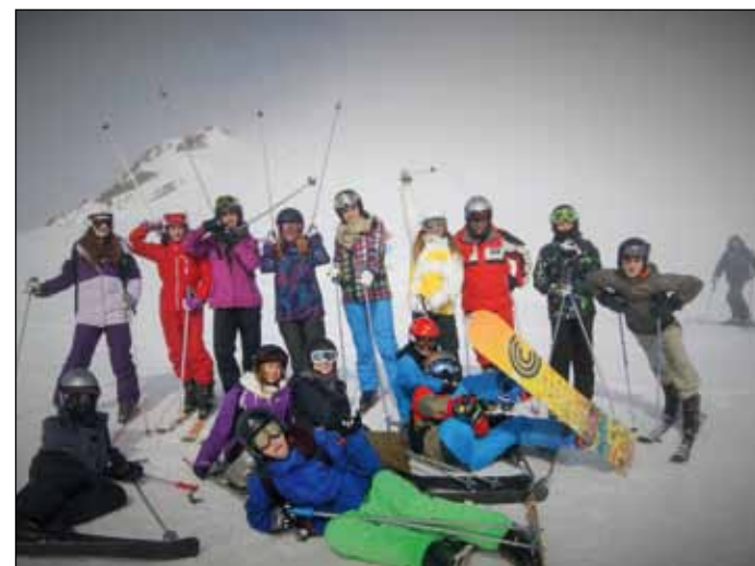
Camps de ski.