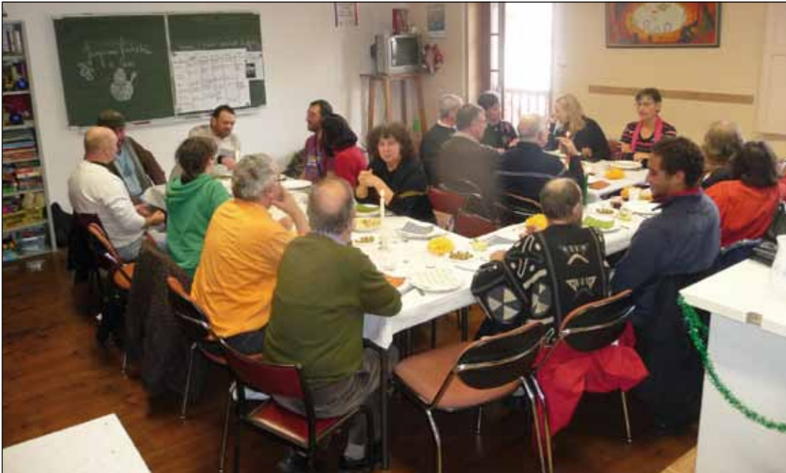
Repas de Noël avec les sdf.

C'est une équipe d'une vingtaine de bénévoles qui accueille dans son local de l'ancienne école Sainte-Elizabeth, rue Saint-Jacques tous ceux qui cherchent aide, soutien et accompagnement. Le lundi et le mercredi de 14h30 à 17h00, c'est l'accueil autour d'un café, d'un thé pour échanger avec d'autres, poser ses problèmes, se sentir écouté, conseillé. À la permanence du lundi, sont reçues individuellement les personnes qui, en lien avec les services sociaux, ont besoin d'un secours financier, de l'obtention d'un microcrédit ou d'une aide pour des démarches administratives ou autres. Le Secours catholique c'est aussi la boutique solidaire de la place du Kiosque à Socoa ouverte à tous le mardi et le jeudi de 15h00 à 18h00 qui vend vêtements et linge de maison à tout petits prix mais qui se veut avant tout un lieu d'écoute chaleureux. Un vestiaire réservé uniquement aux sans-abri fonctionne