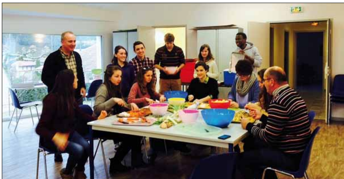
Les légumes sont épluchés, en rythme et avec le sourire, pour préparer une soupe onctueuse pleine de vitamines.

La « Table du soir » fournit gratuitement des repas chauds aux personnes en difficulté.