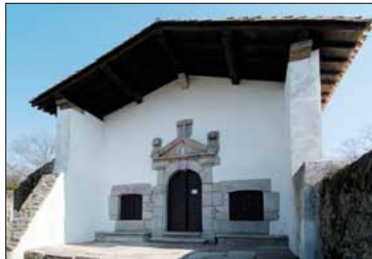
La chapelle du XVIII e siècle